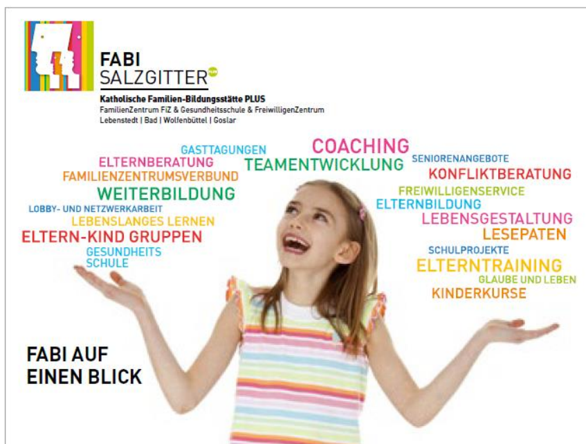
Flyer FABI auf einen Blick

Wir danken unserem Träger, dem Bischöflichen Generalvikariat Hildesheim, dem niedersächsischen Sozialministerium und dem Landesamt, sowie der Stadt Salzgitter und dem Landkreis Wolfenbüttel und unseren Kooperations- und Netzwerkpartnern, allen Referentinnen und Referenten, Einrichtungen, Ämtern und Förderern, die unsere Arbeit im vergangenen Jahr finanziell und ideell unterstützt haben.