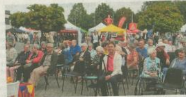
Rathausvorplatz und Otto-Brenner-Platz in Lebenstedt waren