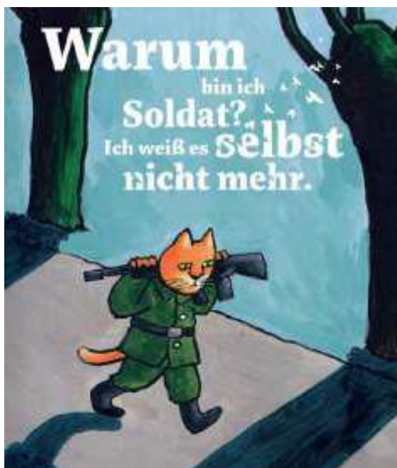
©Mario Ramos. Ill.aus: „Le petit soldat qui cherchait la guerre“

unter dem Hashtag #WeStandWithUkraine gezeigt. Die Ausstellung ist ein Zeichen der Solidarität mit den Menschen in der Ukraine, insbesondere mit den Kindern, die dem brutalen Angriff auf ihr Land ausgesetzt sind, Gewalt und Zerstörung erleben und aus ihrer Heimat fliehen, um Schutz zu finden.