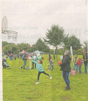
„Salzgitter spielt“ zog am Samstag viele Besucher auf die Wiese neben den Piratenspielplatz.