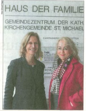
HAUS DER FAMILIE GEMEINDEZENTRUM DER KATH. KIRCHENGEMEINDE ST. MICHAEL

der Familienphase, nahmen Angebote mit Kind wahr und mach-