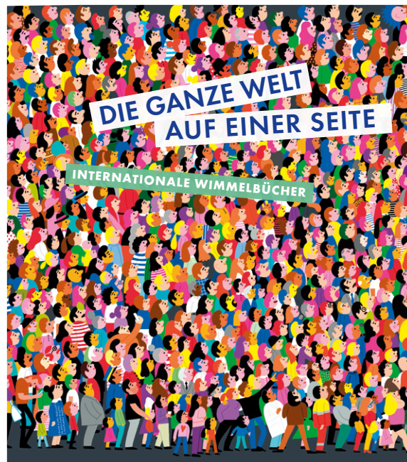
Eine Wanderausstellung der Internationalen Jugendbibliothek, www.ijb.de