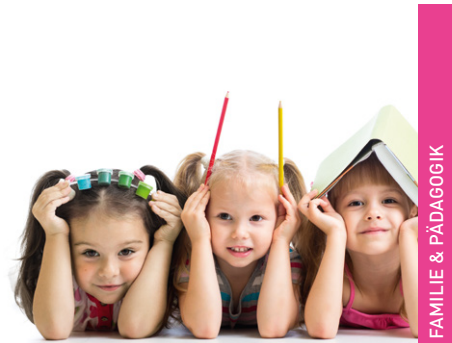
FAMILIE & PÄDAGOGIK