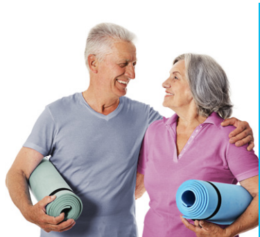
GESUNDHEIT, FREIZEIT & KREATIVITÄT