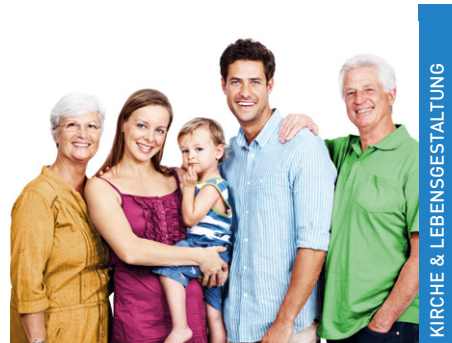
KIRCHE & LEBENSGESTALTUNG