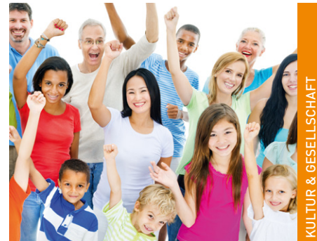
KULTUR & GESELLSCHAFT